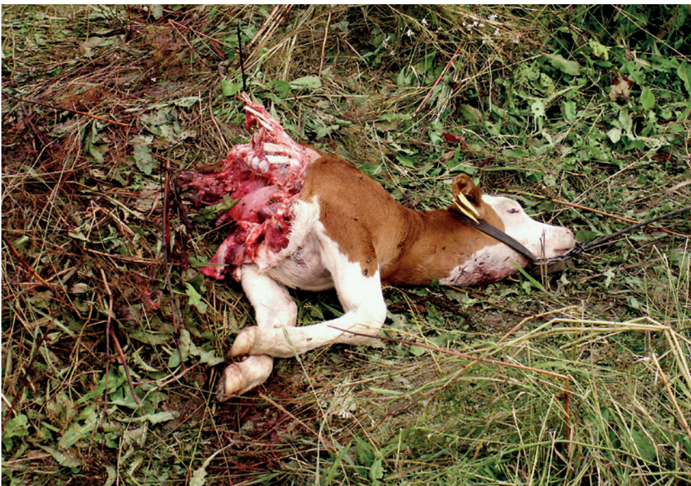
Fot. 9. Cielę zabite przez wilki w Beskidzie Śląskim. Zwierzęta wypasane na uwięzi są łatwą zdobyczą dla drapieżników